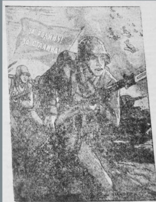
Битва под Сталинградом. Снимок корреспондента в разгаре боя.